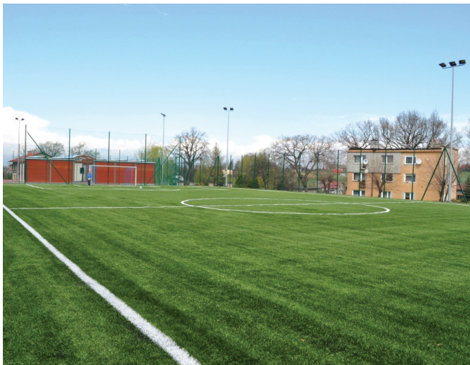
Boisko „Orlik” w Bestwinie