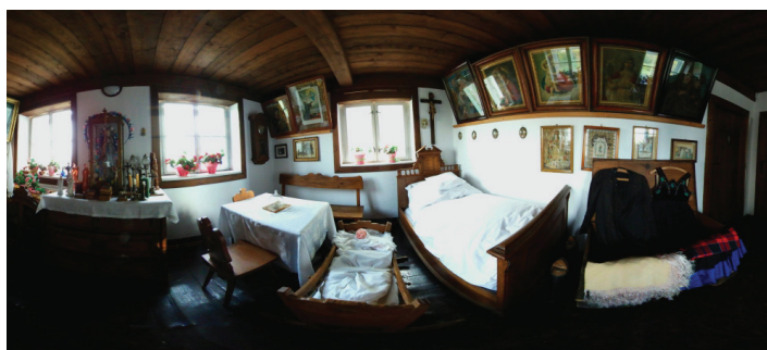
Ekspozycja stała – widok panoramiczny

Szczegóły na stronach internetowych Muzeum i GOK.