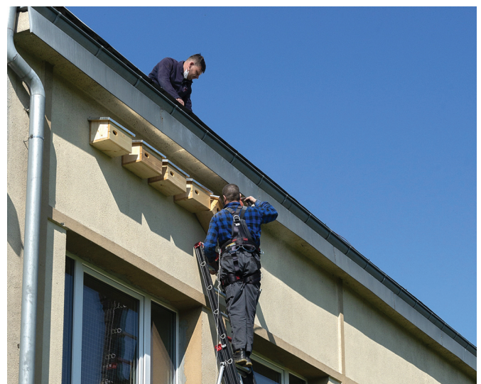
Montaż budek dla ptaków.