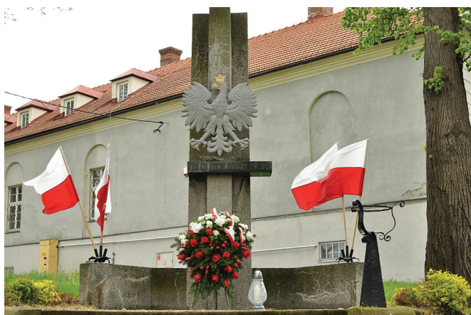
Pomnik przy Urzędzie Gminy