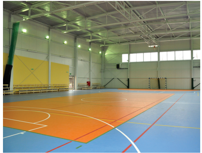
Hala sportowa w Kaniowie