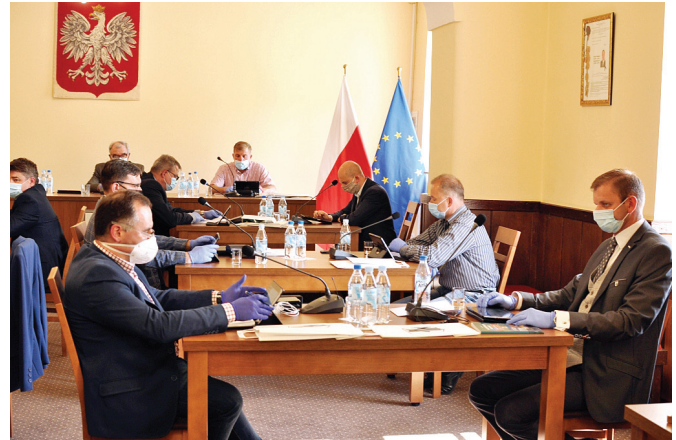
Obrady XIX sesji Rady Gminy Bestwina

Wykonanie zamknęło się nadwyżką w kwocie 6 041 761, 80 zł., zadłużenie z tytułu zaciągniętych pożyczek i kredytów