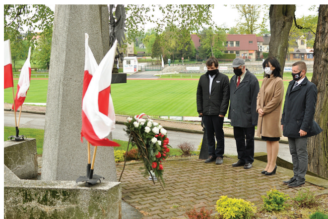
Złożenie kwiatów przez samorządowców